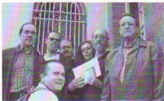
● Miembros de la Asociación de Amigos de M. Hernández ante la casa de V. Aleixandre.

Convocados por la Asociación de Amigos de Vicente Aleixandre, varios centenares de personas se concentraron el día 30 de septiembre ante la casa que habitó tantos años Vicente Aleixandre en la calle Velingtonia en Madrid.