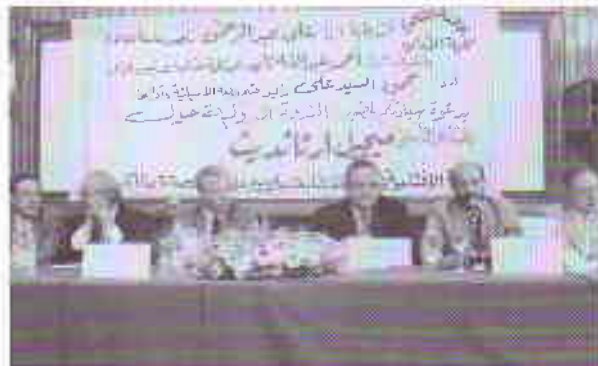
● Mesa de conferenciantes en la Universidad de El Cairo