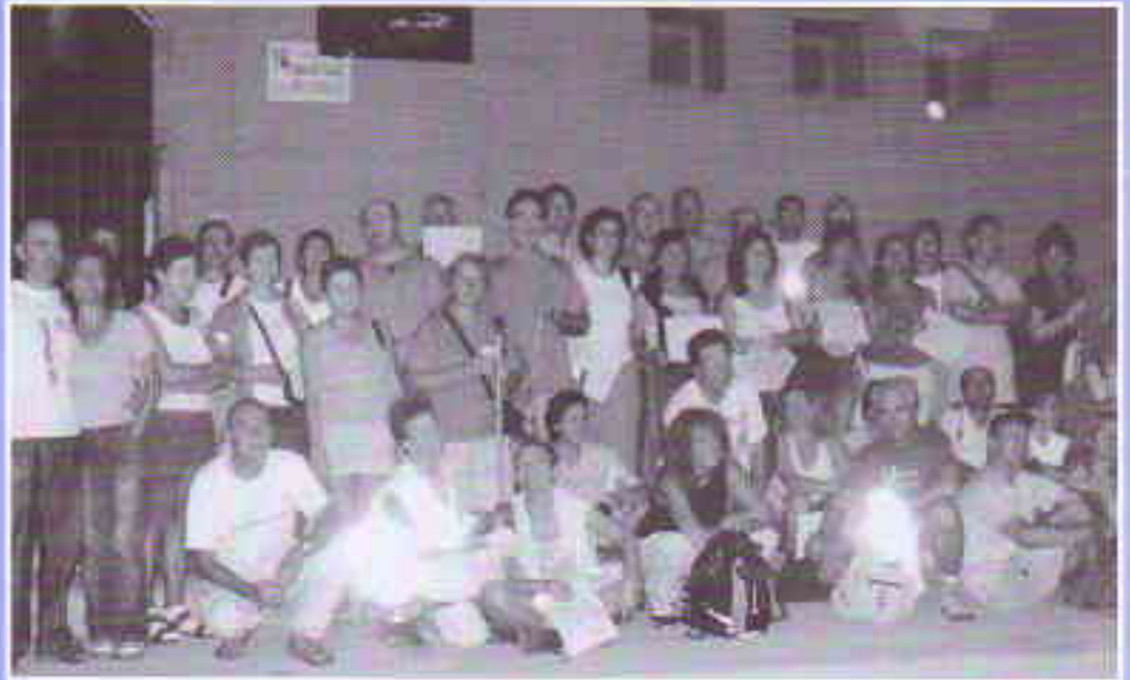
Grupo de senderistas participantes en la I Ruta Nocturna "Perito en lunas"

Boletín Hernandiano ● N°18 ● 30 Octubre 2006